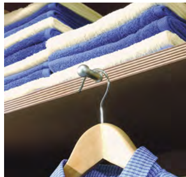
Kleiderhaken für Fachböden