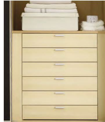
6er Schubkasteneinsatz mit Griffen, optional mit Softeinzug