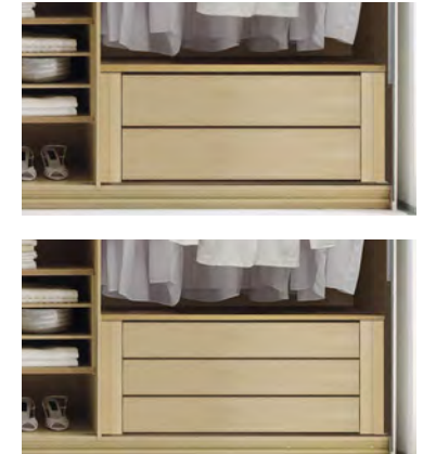
2er oder 3er Schubkasteneinsatz ohne Griffen, optional mit Softeinzug