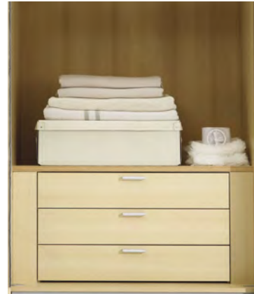
3er Schubkasteneinsatz mit Griffen, optional mit Softeinzug