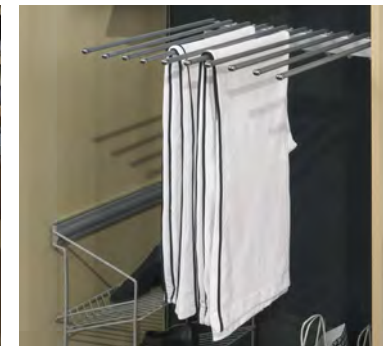
Ausziehbarer Hosenhalter schmal