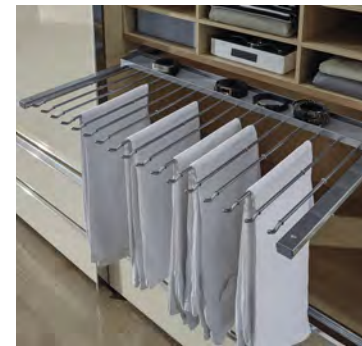
Ausziehbarer Hosenhalter breit