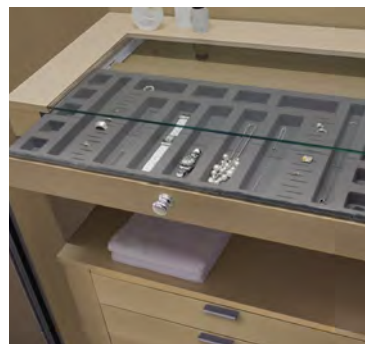
Schmuckschubkasten gedämpft mit schützender Glasplatte