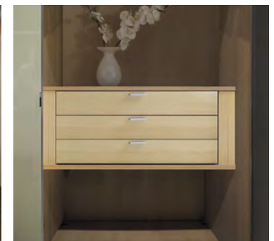
3er Hängeschubkasten mit Griffen, optional mit Softeinzug