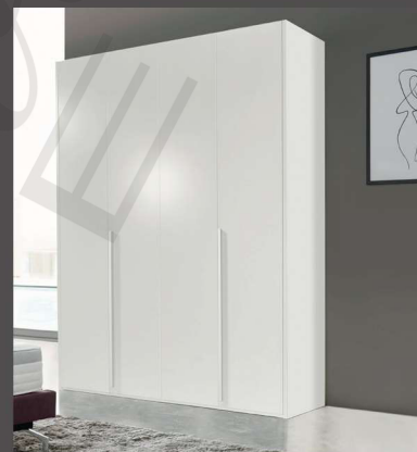
Artikel E1402 | B:202 cm