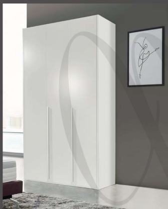
Artikel E1302 | B:152 cm