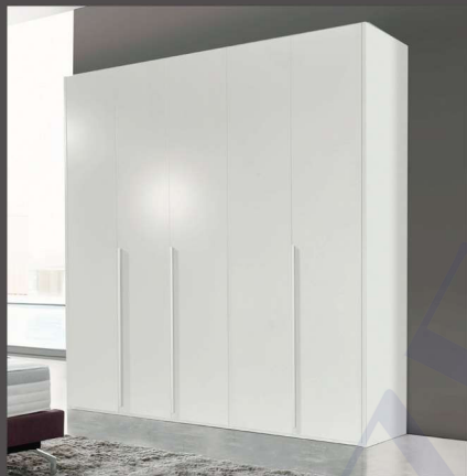
Artikel E1502 | B:252 cm