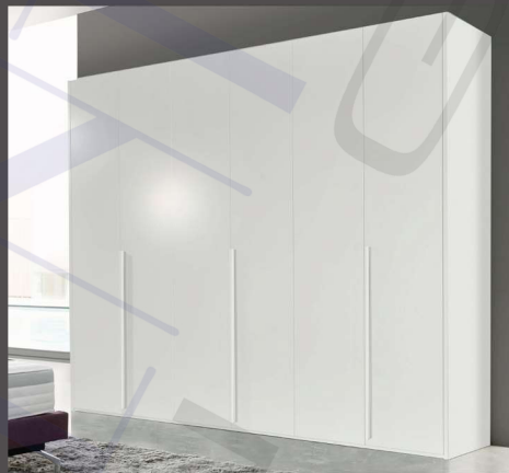
Artikel E1602 | B:302 cm