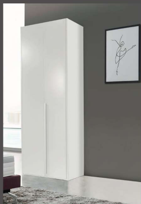
Artikel E1202 | B:102 cm